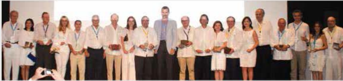
Premiación 2013. XXIV Asamblea Plenaria CEAL. Panamá.