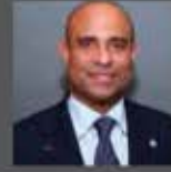
LAURENT LAMOTHE ExPrimer Ministro, Haití