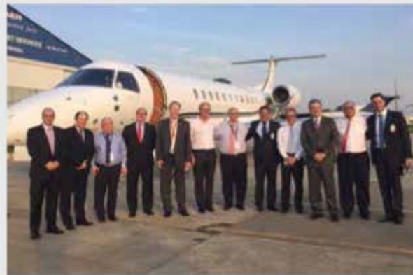
Visita Embraer, Asamblea Plenaria Río de Janeiro Brasil