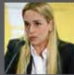
LILIAN TINTORI Esposa del Líder opositor Leopoldo López, Venezuela