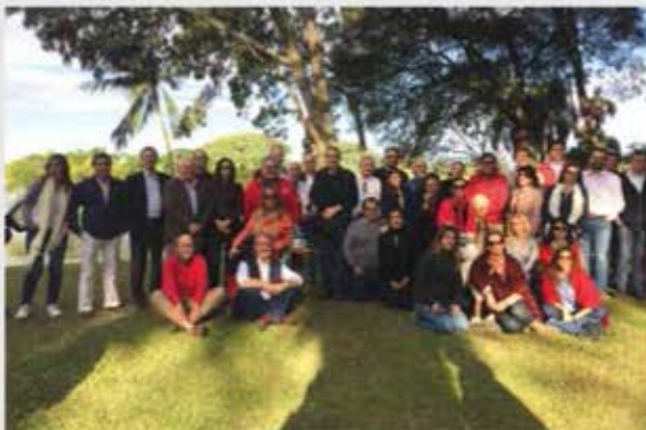
Hacienda Benasal, Junta Ampliada Santa Cruz Bolivia