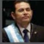
EXCMO. JIMMY MORALES Presidente Rep. de Guatemala (Por Confirmar)