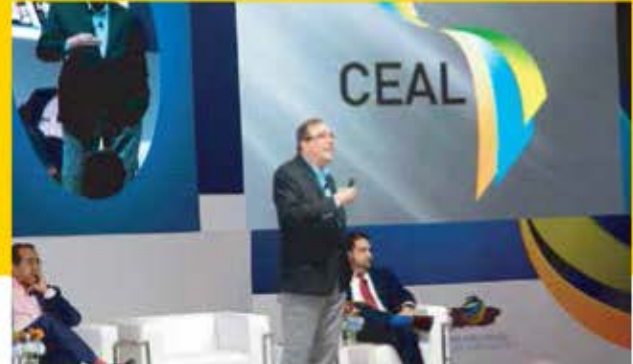
Panel, Oportunidades de Negocios en Cuba, Moderador, Carlos Alberto Montaner, analista y periodista.

La Junta Ampliada continuó con otro de los paneles más esperados en el que se debatió sobre las Oportunidades de negocios en Puerto Rico. En dicho panel, se presentó la perspectiva reciente que exige apostar por la integración en América Latina, identificando y poniendo en marcha iniciativas estratégicas que contribuyan a reforzar las relaciones de Puerto Rico con la región, atrayendo inversiones y fortaleciendo las relaciones comerciales. Se presentaron las ventajas que ofrece Puerto Rico a las empresas, incluyendo que los negocios se realizan amparados en el sistema legal y jurídico de Estados Unidos, pero en idioma español; Puerto Rico es mucho más que la puerta de entrada de los negocios a Estados Unidos; la economía de Puerto Rico es competitiva y puede ayudar a expandir las empresas de América Latina en Estados Unidos y que existen importantes incentivos fiscales que ofrecen unas ventajas competitivas en materia de pago de impuestos, entre otros aspectos.