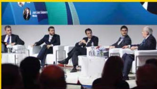
Panel, Emprendimiento e Internacionalidad.