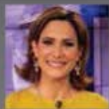
MARÍA ELVIRA SALAZAR Periodista CNN Latino y GENTV, EE.UU.