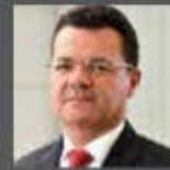
BESAJIEL BOTELHO CEO de Bosch Latinoamérica, Brasil