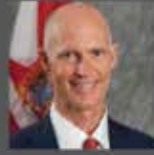
RICK SCOTT Gobernador de Florida (Por Confirmar)