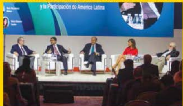
Panel, El Comercio Internacional y la Participación de América Latina.