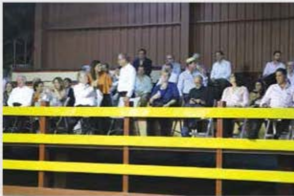
Cortijo Social, Junta Ampliada Managua Nicaragua