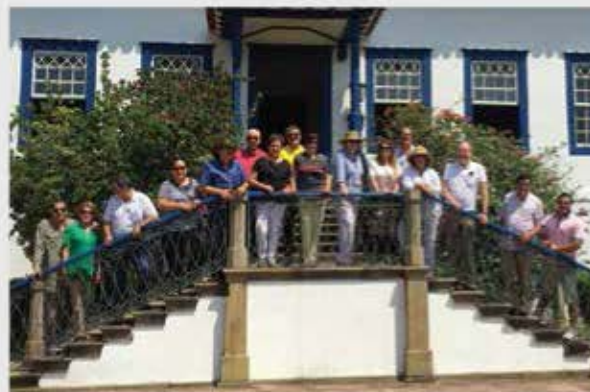
Hacienda Cafetera Asamblea Plenaria Río de Janeiro Brasil