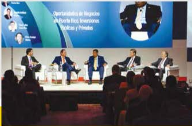
Panel, Oportunidades de Negocios en Puerto Rico.