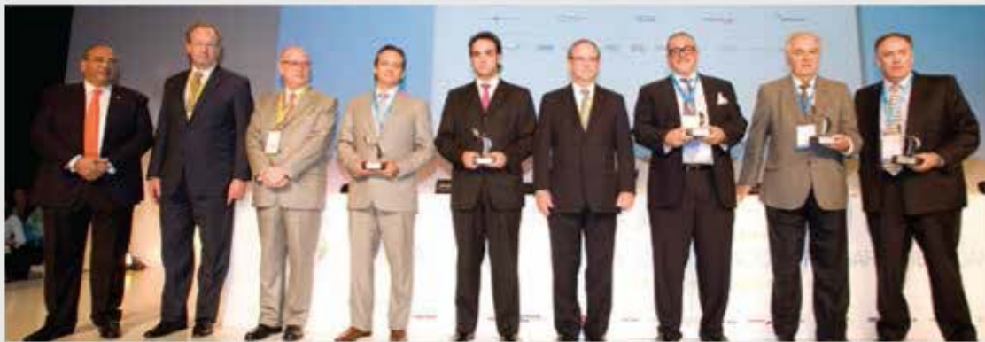
Premiación 2014. XXV Asamblea Plenaria CEAL. Madrid, España.