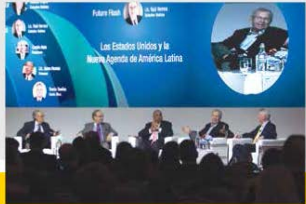
Panel, Los Estados Unidos y la Nueva Agenda de América Latina.