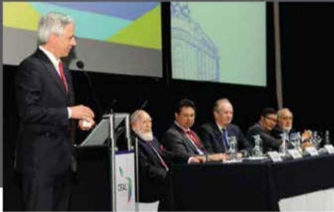
Sesión de apertura: Disertación del Excmo. Álvaro García Linera Vicepresidente del Estado Plurinacional de Bolivia.