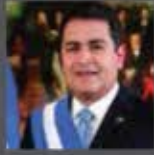
EXCMO. JUAN O. HERNÁNDEZ Presidente República de Honduras