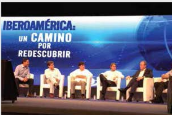
XI Encuentro Empresarial Iberoamericano, Cartagena Colombia