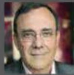
CARLOS ALBERTO MONTANER Analista y Periodista, EE.UU.