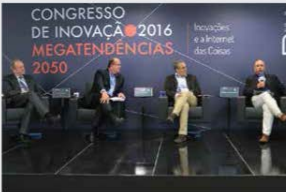
Congreso de Innovación y Megatendencias, São Paulo Brasil