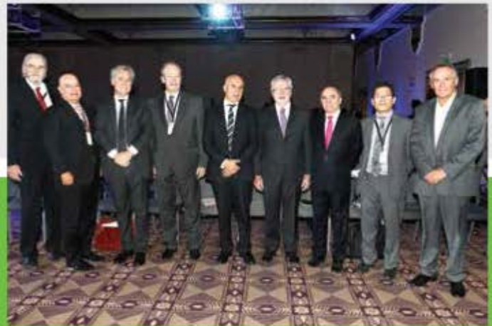
Distinguidos panelistas e invitados