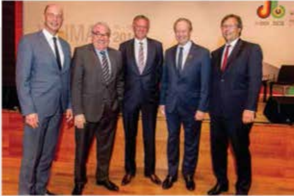
Encuentro Económico Brasil-Alemania, Weimar 2016