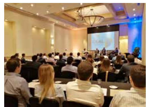
Participantes del conversatorio.