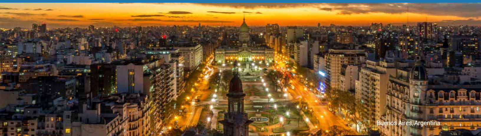
Buenos Aires, Argentina.

Los Capítulos CEAL son la voz del Consejo y la fuerza que promueve nuestro rol a nivel local en América Latina. Son quienes crean espacios y agrupan los países para compartir nuestros objetivos y valores en común, la democracia, el respeto a los derechos humanos y al estado de derecho.