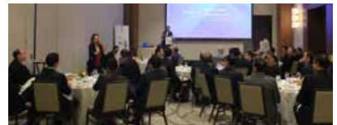
Conversatorio con el candidato presidencial Rómulo Roux, Partido Cambio Democrático.