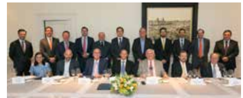
Diálogo con el Secretario de Agricultura y Desarrollo Rural-SADER, Dr. Víctor Villalobos Arámbula.

En estas 3 ocasiones, los miembros del Capítulo manifestaron su disposición para evaluar las iniciativas del gobierno mexicano y apoyarlas desde su ámbito de acción.