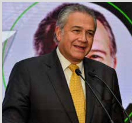
Óscar Naranjo, Exvicepresidente de Colombia y General Retirado de la Policía Nacional de Colombia.

En América Latina la confianza se encuentra afectada profundamente y enfrentamos una desesperanza regional. Hoy es la región más violenta del mundo con una tasa de homicidios de 21,5 por cada cien mil habitantes mientras que la tasa promedio mundial es de 7 por cada cien mil habitantes. La justicia no da abasto y las tasas de impunidad siguen siendo injustamente altas. El sistema carcelario está desbordado y la política pública de seguridad de los diferentes estados ha fallado y su control territorial es deficiente. La corrupción ha permeado las instituciones de los estados y se ha expandido de forma transnacional.