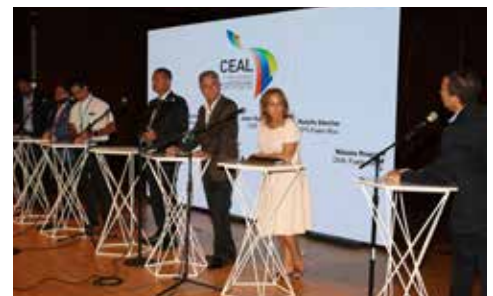
Participantes del segundo workshop "The Role of Business Leaders in Public Affairs".