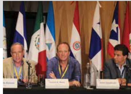
Estados Unidos, Guatemala y Honduras.