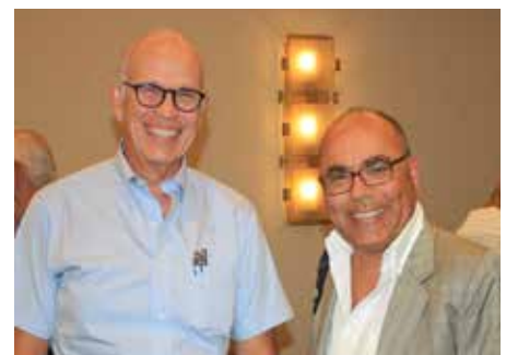
El Salvador y Uruguay.