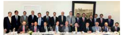
Diálogo con el Coordinador de la oficina de la presidencia de la República Mexicana, Ing. Alfonso Romo Garza.