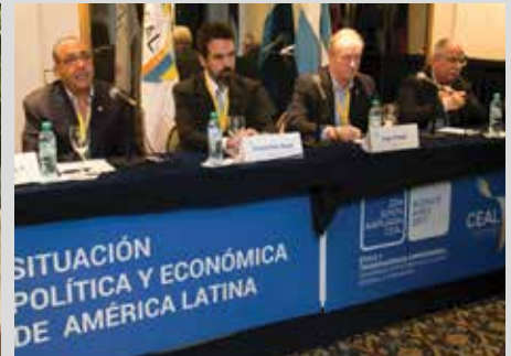
Argentina, Brasil y Paraguay.