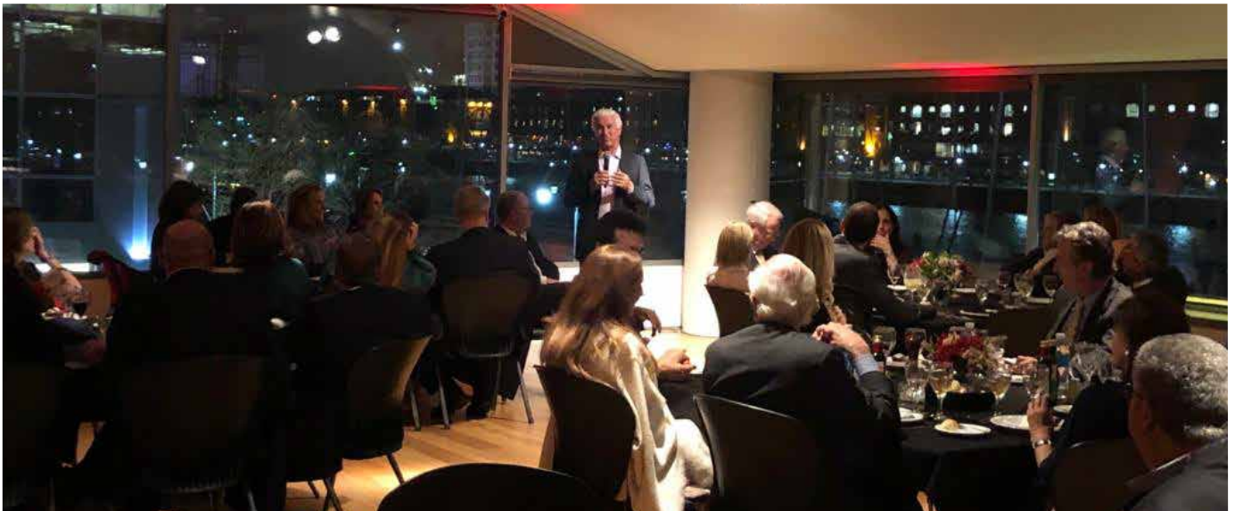
Cena CEAL en el museo Fotabat.