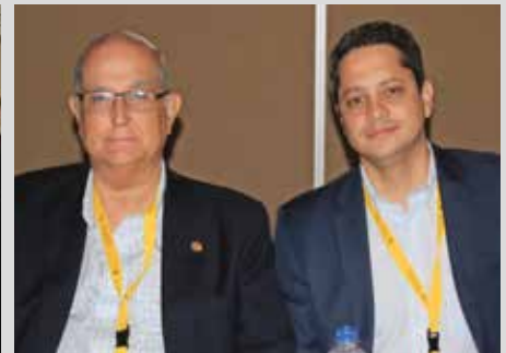
Nicaragua y Costa Rica.