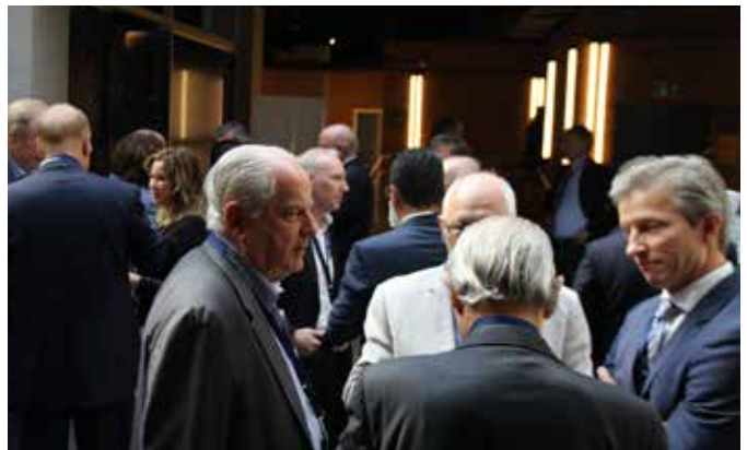
Networking miembros e invitados.