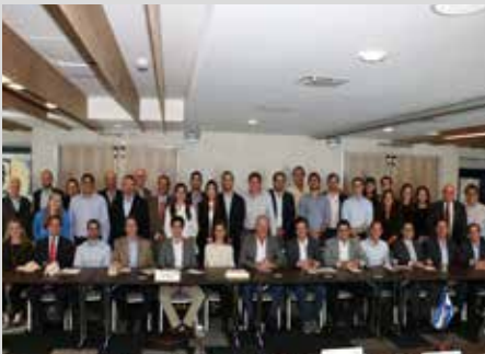
Guatemala, Honduras y El Salvador.