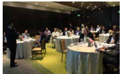
Evento McKinsey & Co., Índice de Madurez Digital.