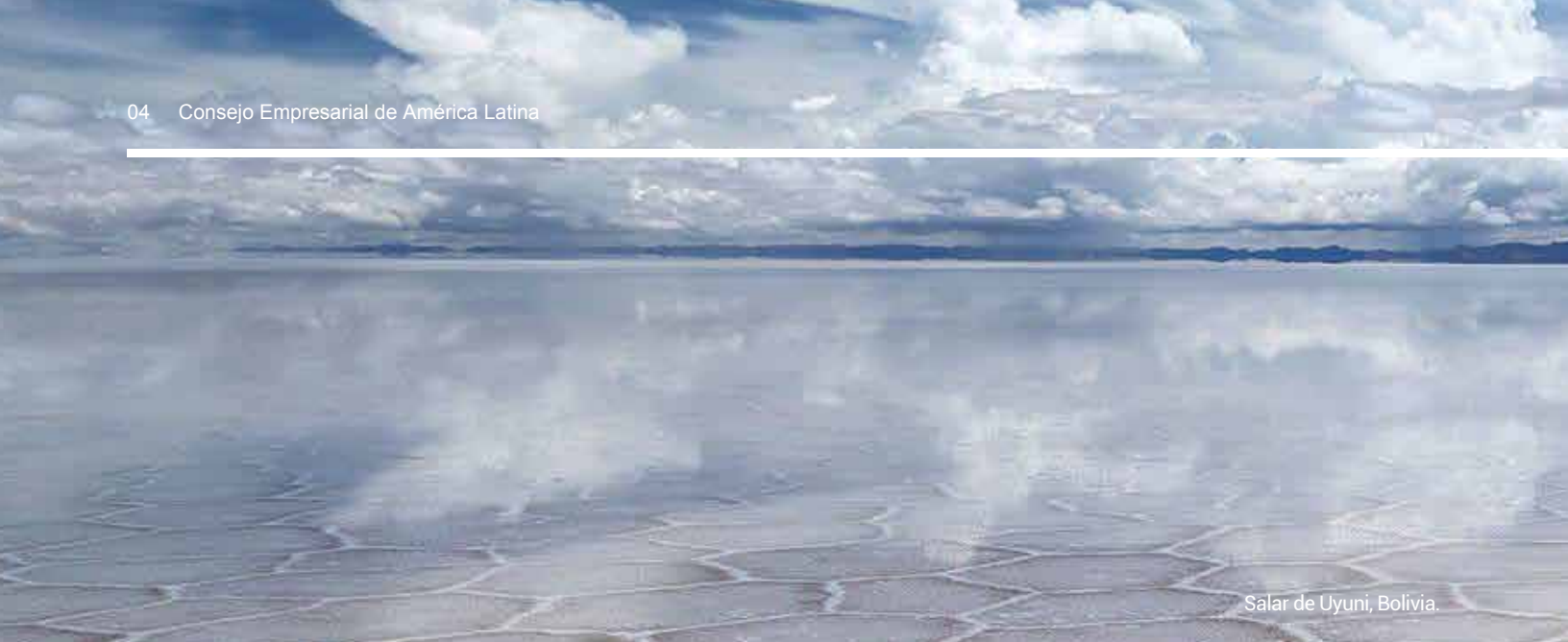
Salar de Uyuni, Bolivia.