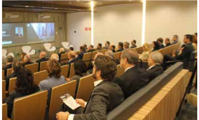
Asistentes al evento.